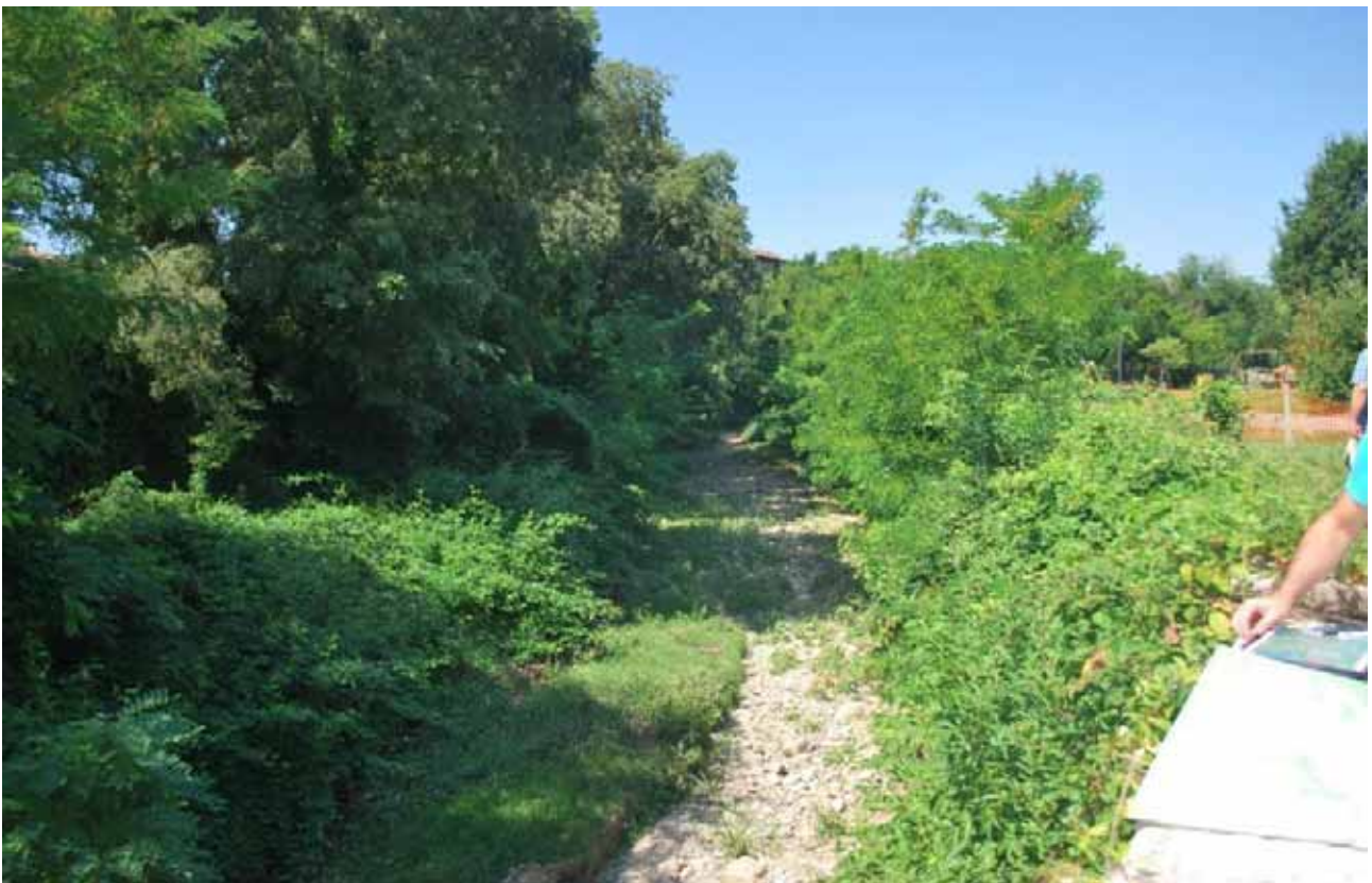
La discreta cortina arboreo-arbustiva che caratterizza le sponde del Torrente Tadone, anche entro l'abitato di Trescore Balneario.