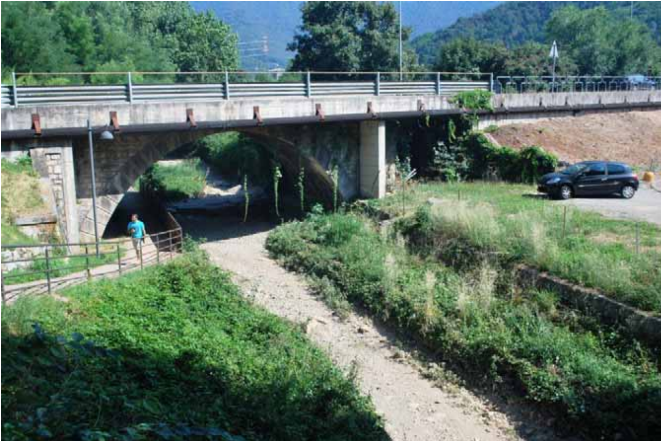
Dettaglio di uno dei viadotti presenti lungo il tratto urbano del Tadone

Si tratta tuttavia di un contesto che ha conservato una linea di continuità ecologica ben definita, che attraverso un’attenta opera di deframmentazione e riqualificazione potrebbe assumere un ruolo cardine nel contesto della rete ecologica locale.